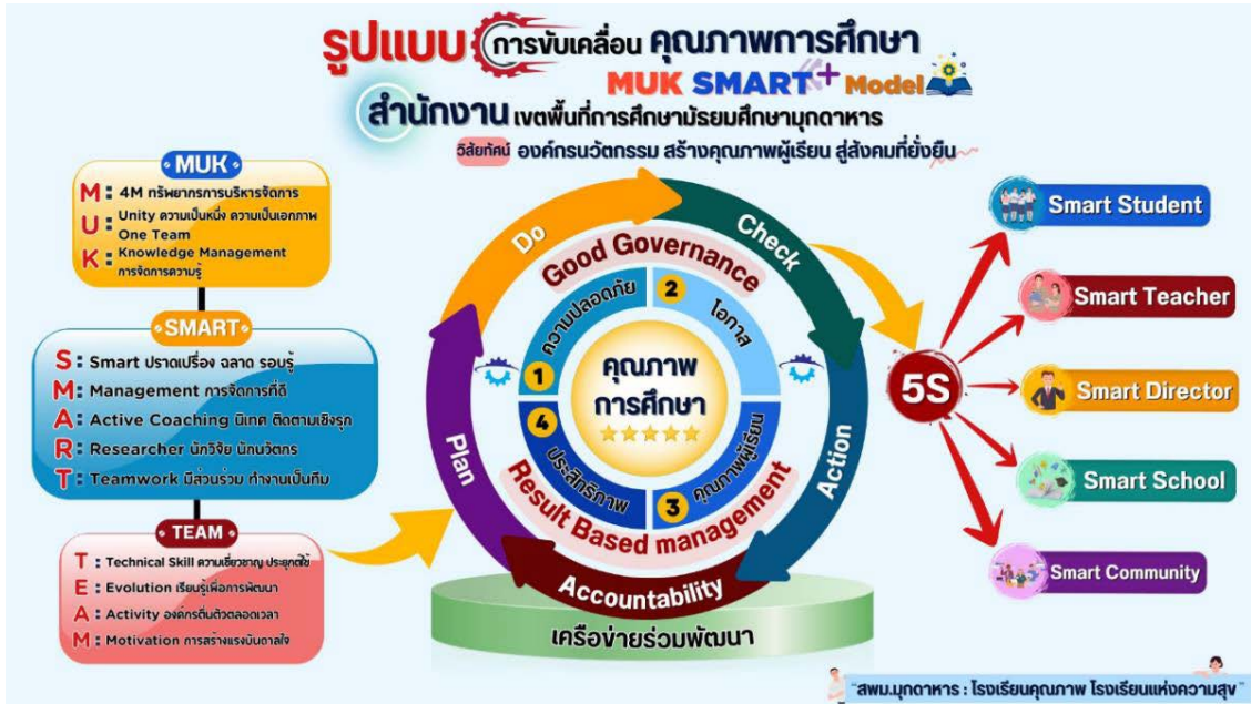
รูปภาพที่ ๒ รูปแบบการขับเคลื่อนคุณภาพการศึกษา MUK SMART+ Model

สำนักงานเขตพื้นที่การศึกษามัธยมศึกษาเขต ๓๓ มีความมุ่งมั่นที่จะพัฒนาคุณภาพการจัดการศึกษาในองค์กร เพื่อยกระดับคุณภาพการศึกษาโดยใช้รูปแบบ MUK SMART+ Model ซึ่งจะขับเคลื่อนโดยใช้เครือข่ายร่วมพัฒนาเป็นฐาน และใช้หลักการของ Deming คือ P-D-C-A (Plan-Do-Check-Act) ในการปรับปรุงคุณภาพ โดยมีเป้าหมาย ดังนี้