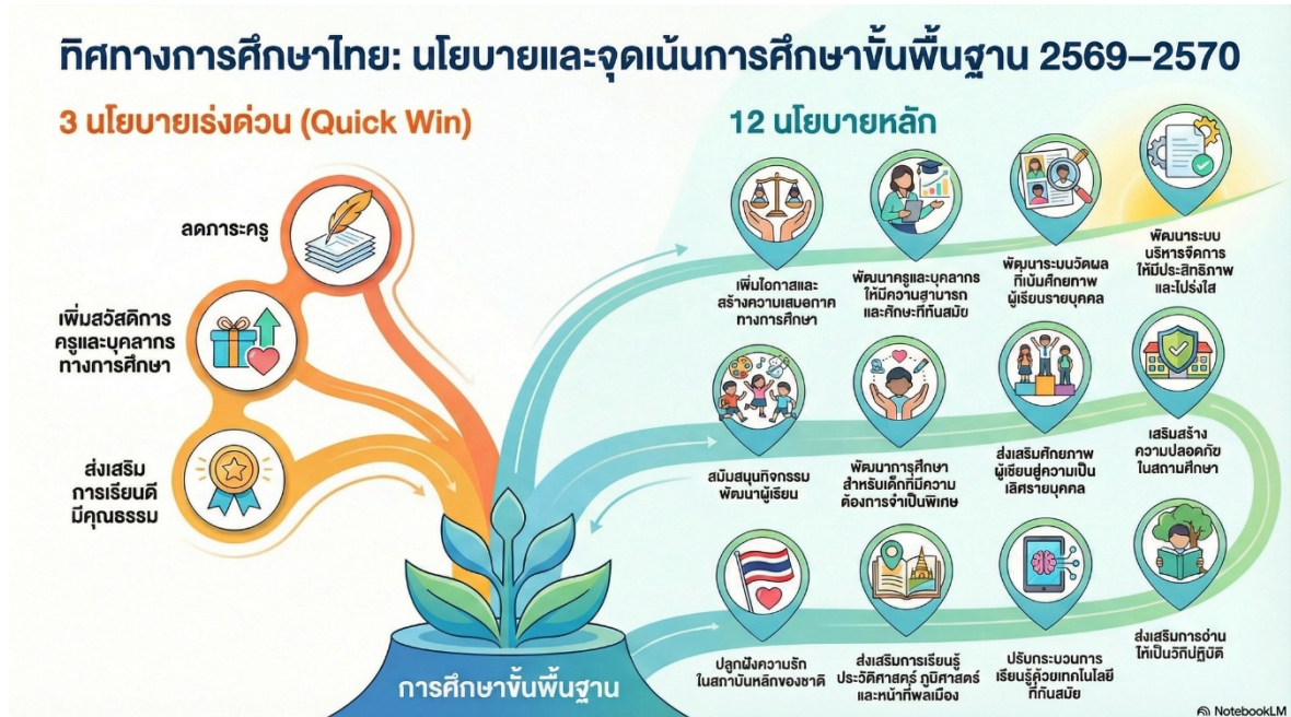
รูปภาพที่ ๑ นโยบายและจุดเน้น สพฐ. ๒๕๖๘ – ๒๕๗๐

ทิศทาง/รูปแบบการขับเคลื่อนคุณภาพการศึกษา สพม.มุกดาหาร (Model) “MUK SMART+ Model”